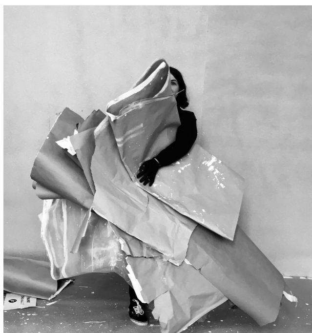
The building of Art Fair Suomi '19.

To say “I feel seen” is to use a rather recent phrase that recognises the uncomfortable qualities of being acknowledged. To be seen is to feel vulnerable, tender, and exposed—all very difficult sensations to avoid within exhibition-making. Commercial exhibition-making feeds on hope, the unlikely coalescing of the desire to be seen, and collides with the economic prosperity necessary to see—we conjure the patron who thinks, “I like it, and I have the money to buy it”. The kirppis aims to lower one of these thresholds (€), while creating a context for that which to be seen to see again. Let's see what happens.